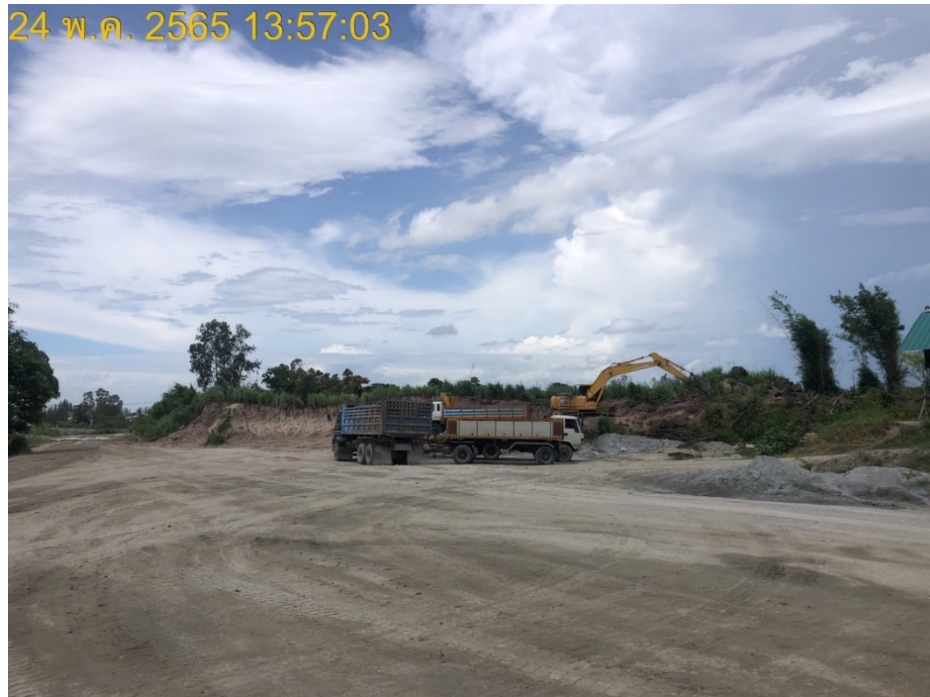
รูปภาพ: การเตรียมพื้นที่ปลูกต้นไม้ด้านทิศเหนือ แนวคันบ่อเหมือง