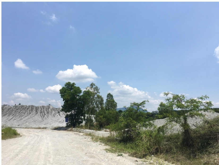
รูปภาพ: การเตรียมพื้นที่ปลูกต้นไม้ด้านทิศเหนือ แนวเขตประทาน