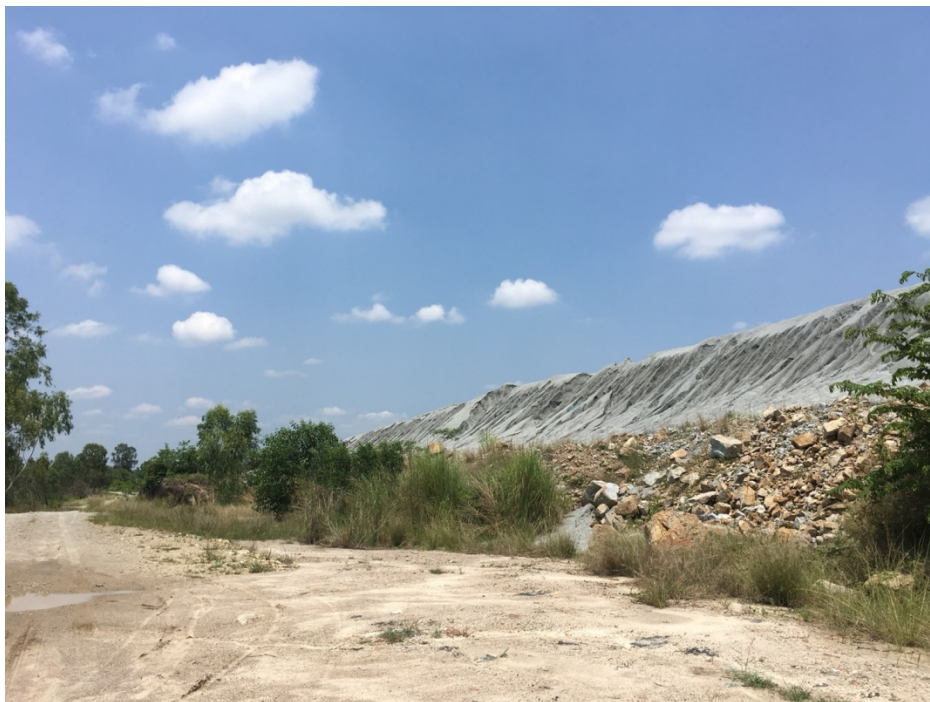
รูปภาพ: การเตรียมพื้นที่ปลูกต้นไม้ด้านทิศตะวันตก แนวคันบ่อเหมือง